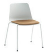
Fixed seat panel Asiento tapizado fijo