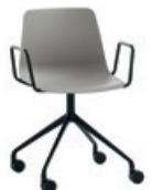
Aluminum swivel base Base giratoria de aluminio + arms / brazos + casters / ruedas