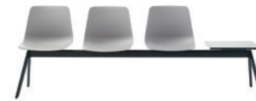
Bench 2-5 seater Banco 2-5 plazas