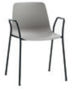
4 leg armchair Sillón 4 patas