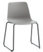
Sled base Pie de varilla