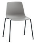
4 leg Silla 4 patas