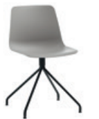
Steel swivel base Base giratoria de acero