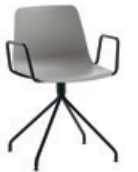
Steel swivel base Base giratoria de acero + arms / brazos