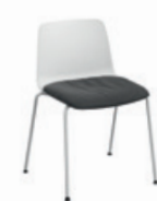
Removable soft seat pillow Almohada de asiento desenfundable