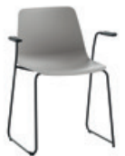
Sled base armchair Sillón pie de varilla