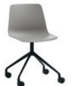
Aluminum swivel base Base giratoria de aluminio + casters / ruedas